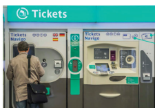
à la machine